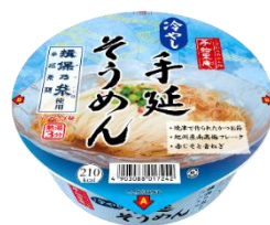
冷やし手延そうめん (期間限定)