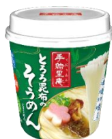
とろろ昆布の そうめん