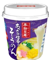
あっさり仕立ての そうめん

「揖保乃糸」を使用した和風カップ麺ブランド「手緒里庵」は、全5品のラインナップとなります。